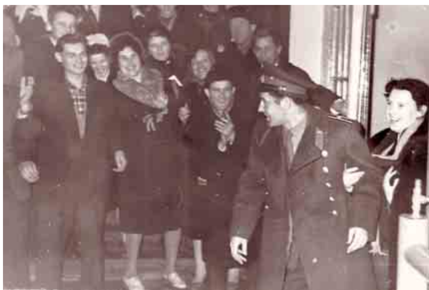
Моя мама с космонавтом Германом Титовым