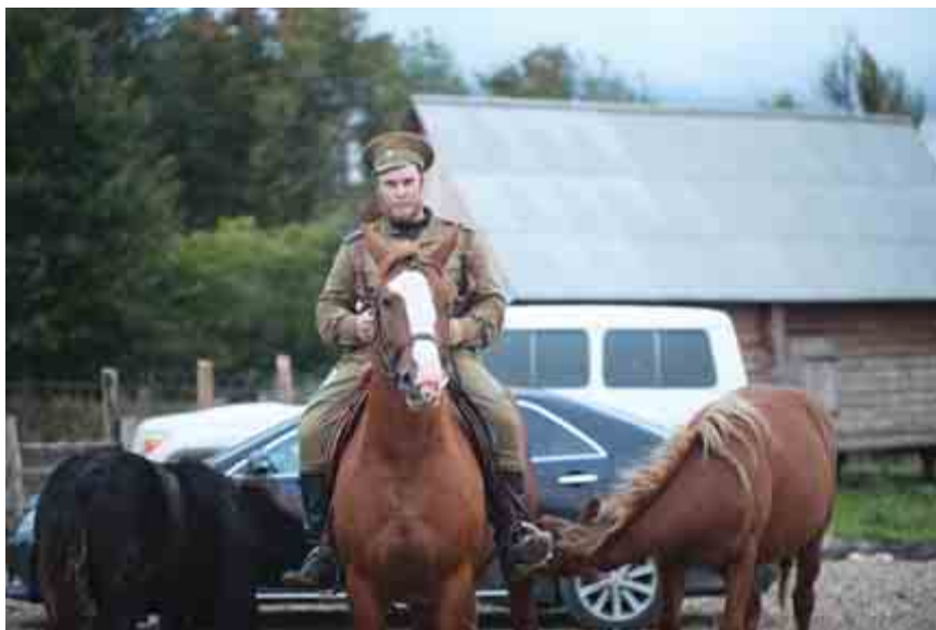
На этом фоне лошади выигрывают