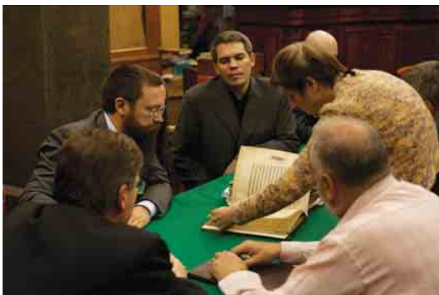
Муж в хранилище питерской библиотеки отбирает рукописи для печати