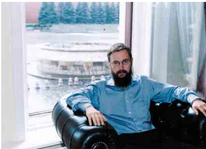
В офисе на Красной площади