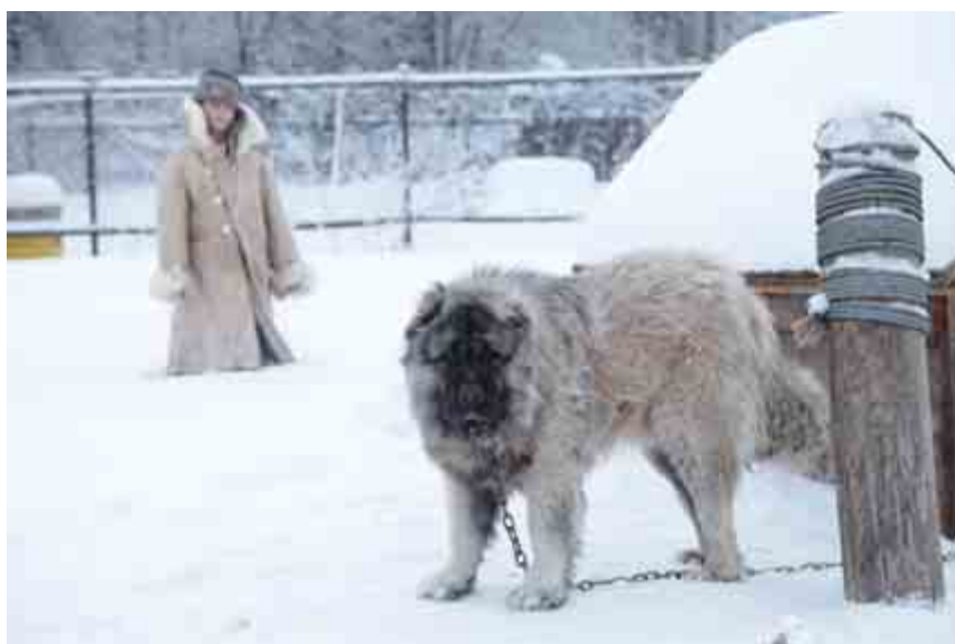
Собака — большая, сын — маленький