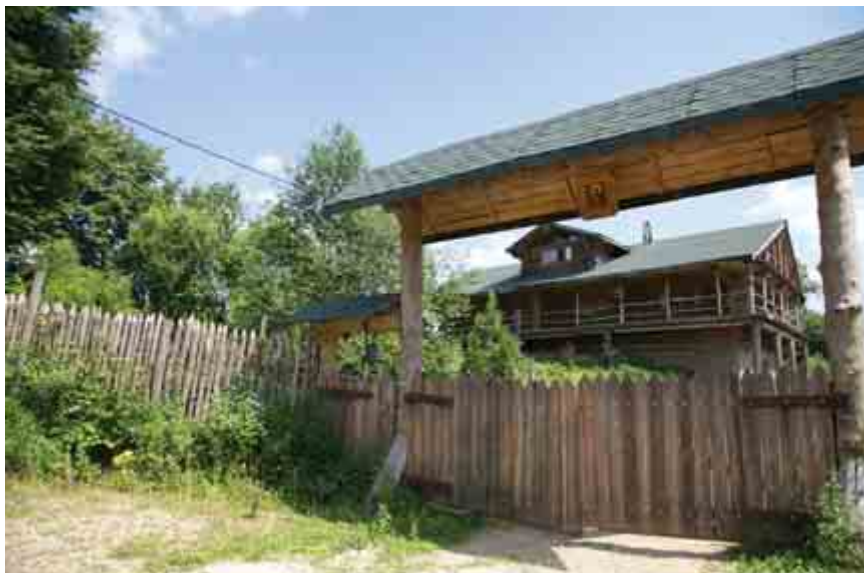
Вид на институт медицины Галена