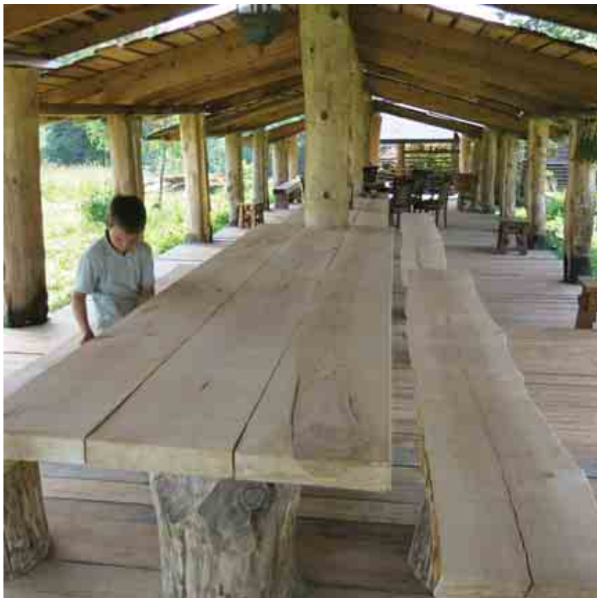
Летняя кухня где происходит прием людей и раздача лицевого свода