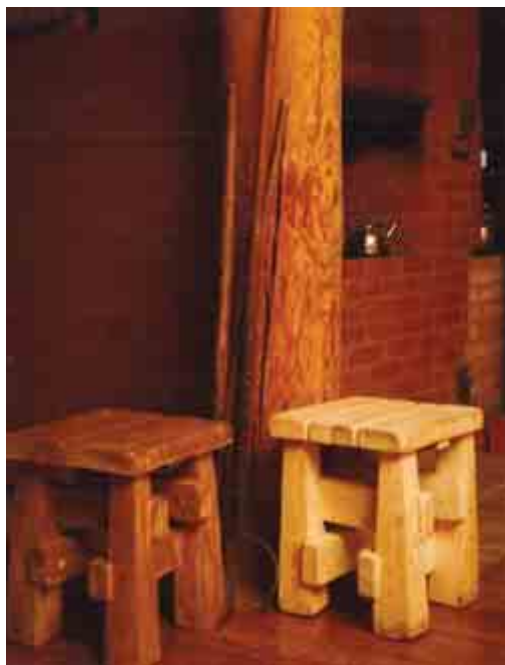
Первая мебель, сделанная на продажу детьми, с логотипом артели братьев Стерлиговых