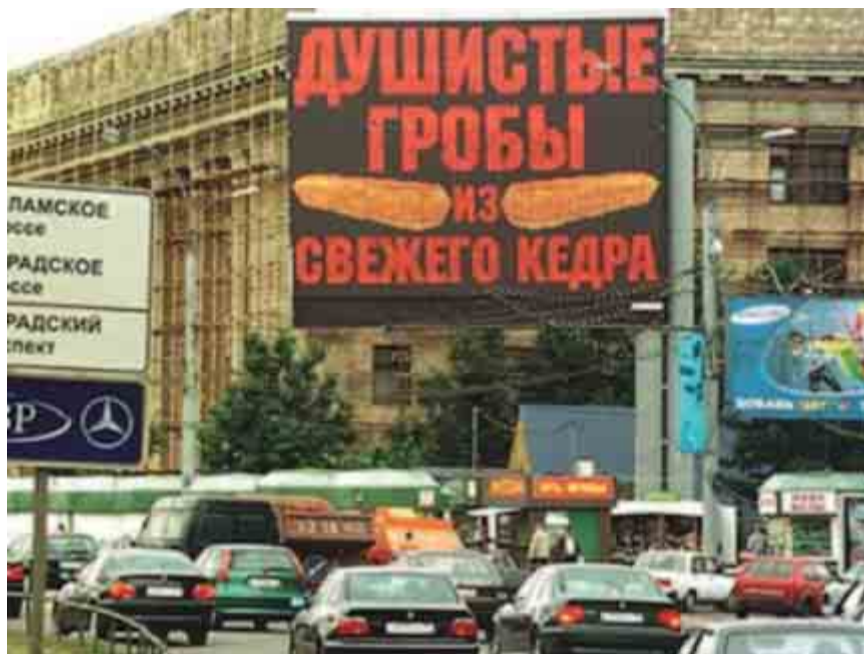
Эта реклама многих водителей ввергала в ступор