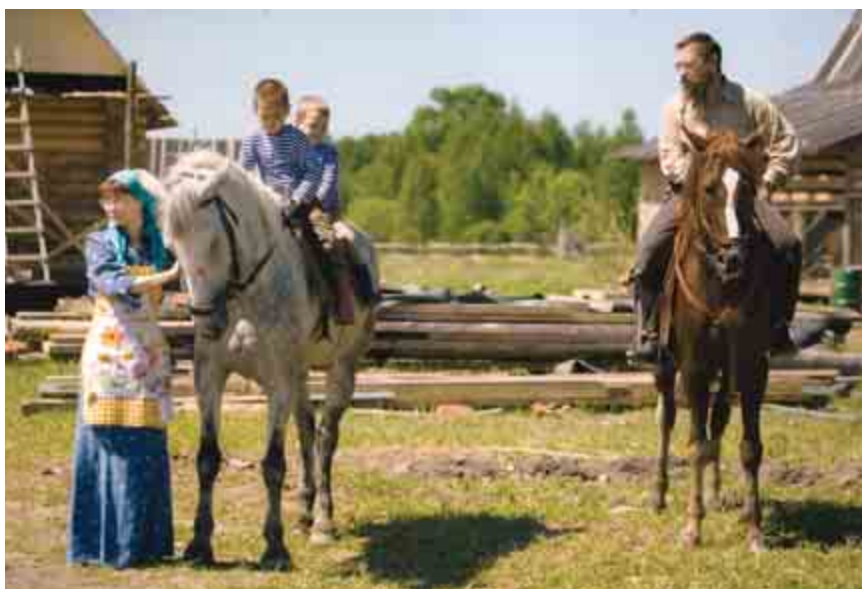
Внизу: Дальняя Слобода