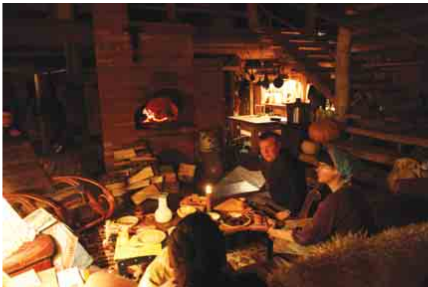
В избушке зимними вечерами