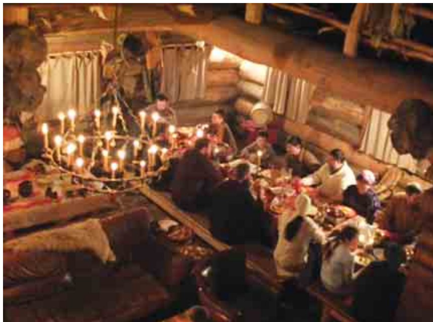
Вверху: Празднование рождества