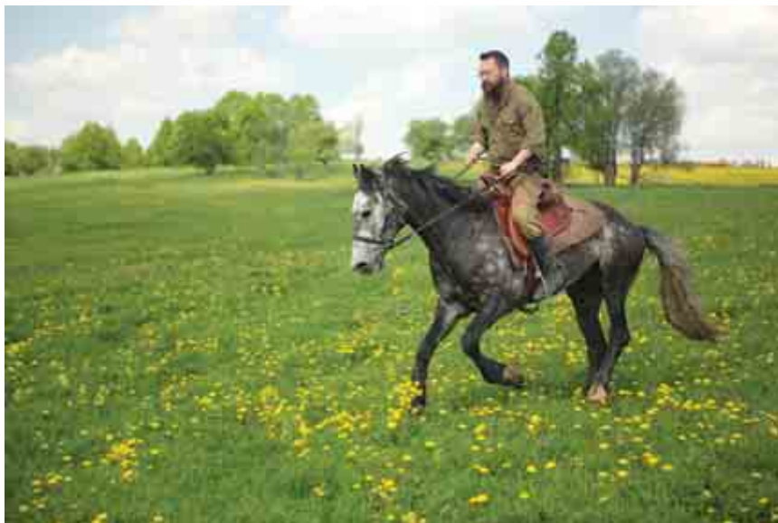
Конь Каштан — выкуп за Пелагею