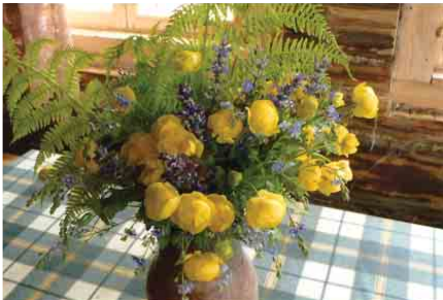
Цветы с нашего пруда. Подарок детей