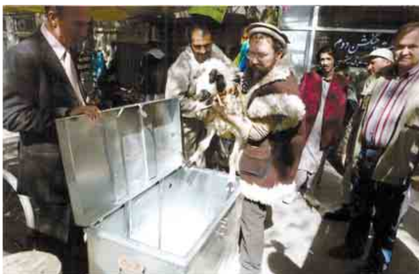
Этого барана должны были доставить в Москву, но его спецслужбы выкрали в Дубае