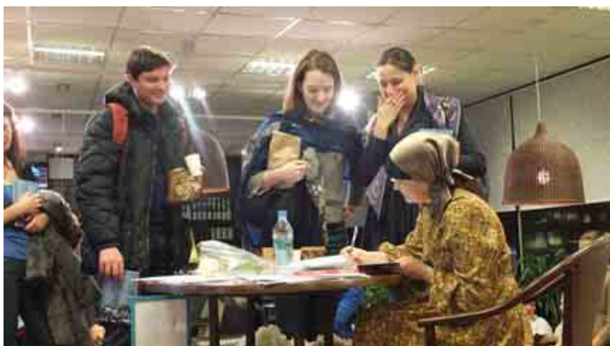
Презентация книги в Доме книги на Арбате