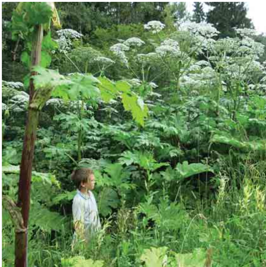
Борщевик, который придумали проклятые ученые и от которого сейчас невозможно избавиться