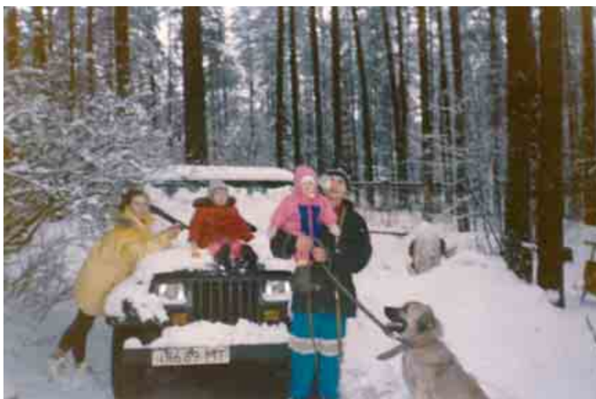
Эвакуация в Комарово.