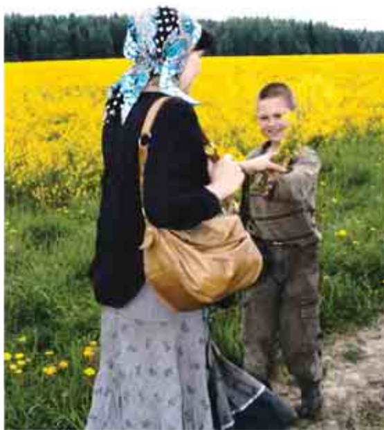
Слева: Сыновья любят дарить мне луговые цветы