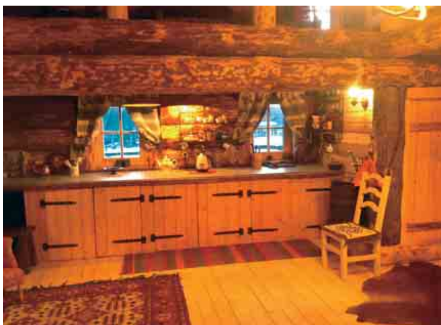
Интерьер женской половины