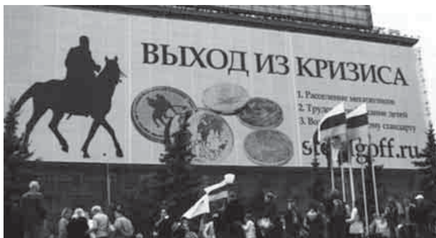
Огромный щит мужа на Кутузовском. Впервые про «расселение мегаполисов и про возвращение к золотому стандарту». Все тогда крутили пальцем у виска...