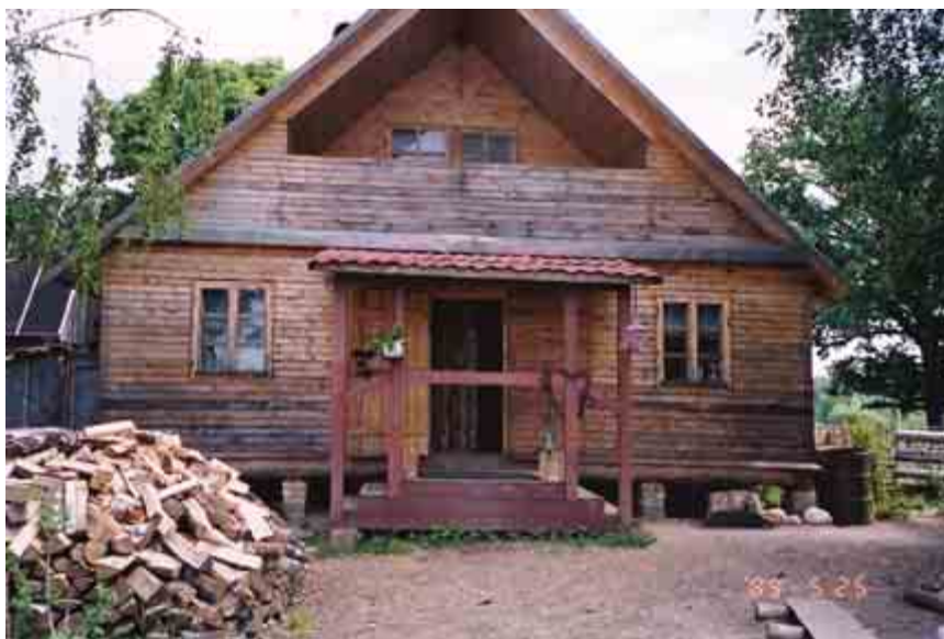
Наш дом в дальней Слободе, в котором мы жили после пожара