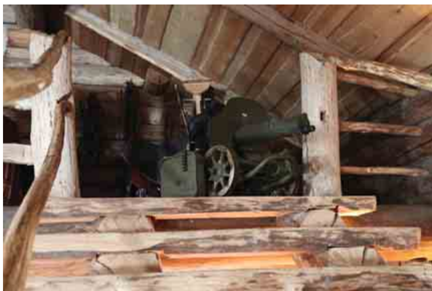
Интерьер мужской половины