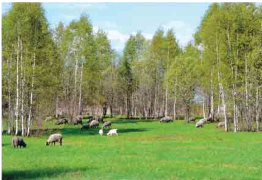
Первые годы после пожара