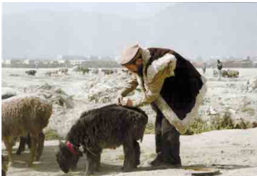
Кабул. Герман в Афганистане выбирает барана