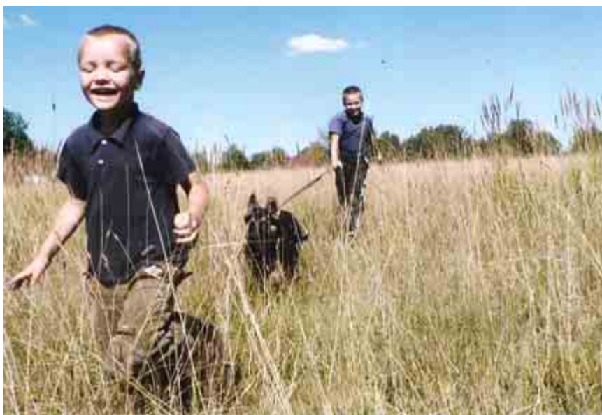
Внизу: Счастливое детство