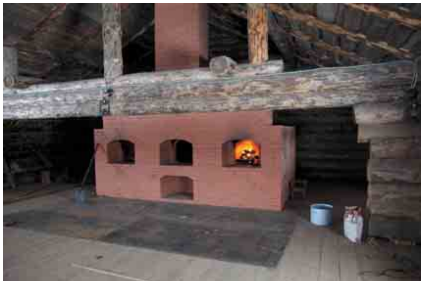
Пекарня, которую достраивают дети, для выпечки настоящего хлеба