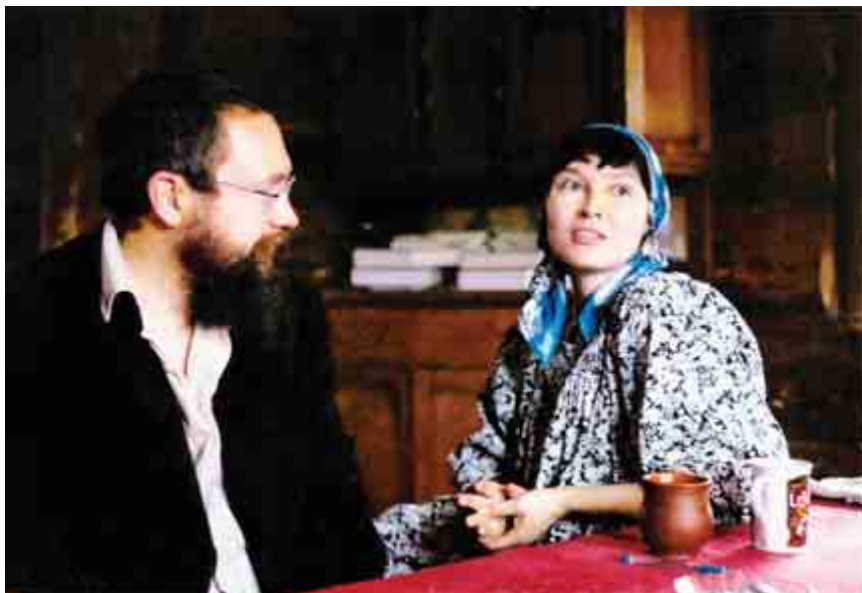
Счастливы быть вместе