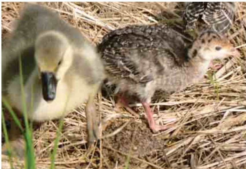
Первые птицы в слободе