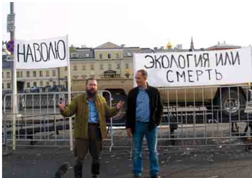
Муж проводит экологический минимитинг на Болотной