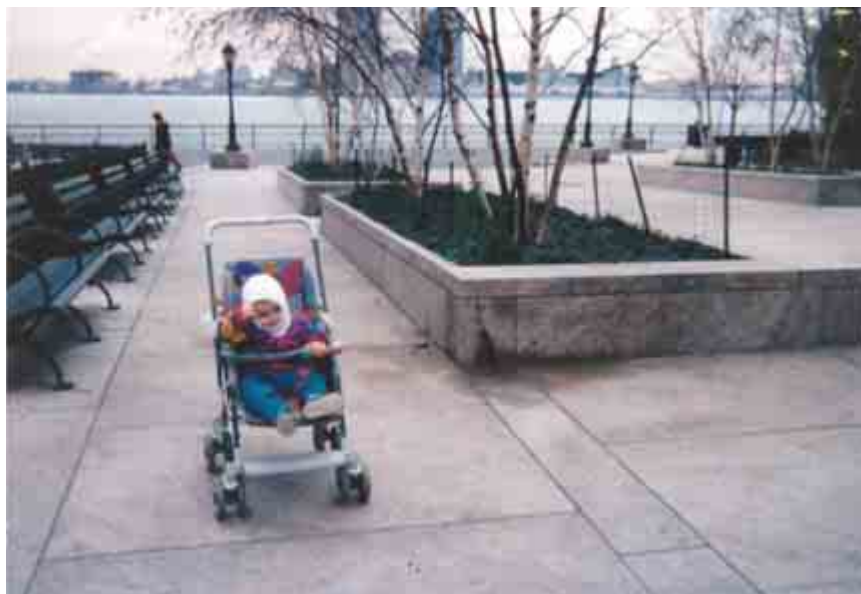
Battery Park City, Нью-Йорк