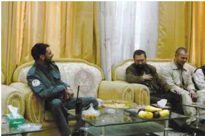
В Афганистане с сопровождающими лицами на приеме у губернатора провинции Герат: слева — председатель КГБ Герата (следующей ночью он же под дулами автоматов и вывез мужа в горы)