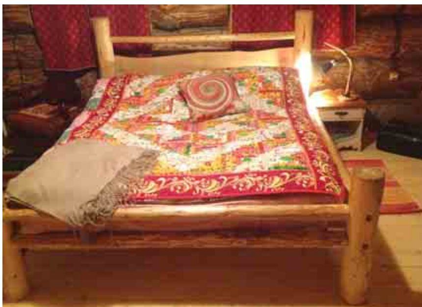
Кровать и лампа из оленьих рогов, подарок сына (на женской половине)