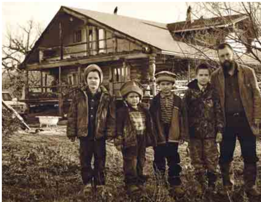
Дом на новой Риге