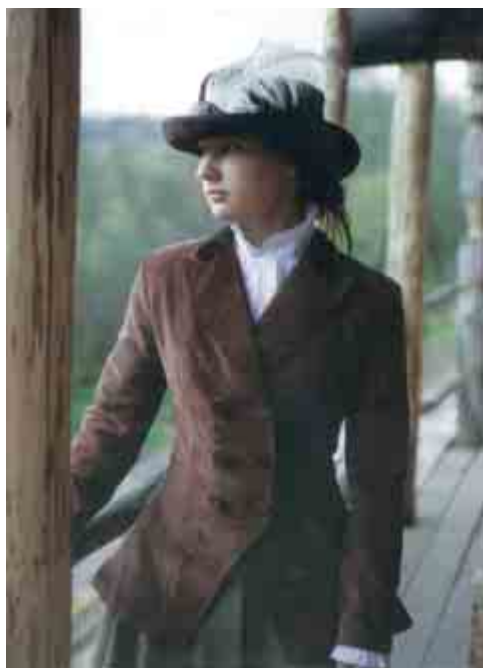
Дочь на выданье