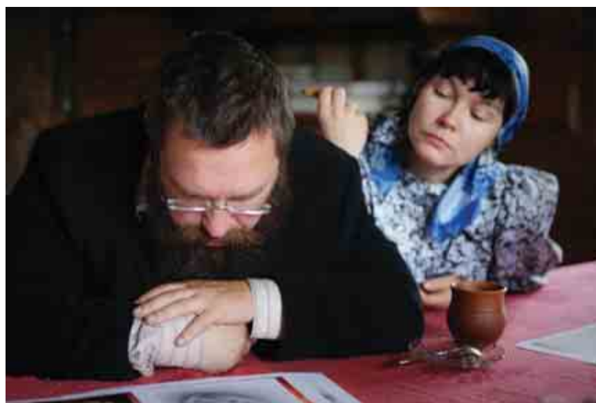
За спиной у мужа в прямом и переносном смысле