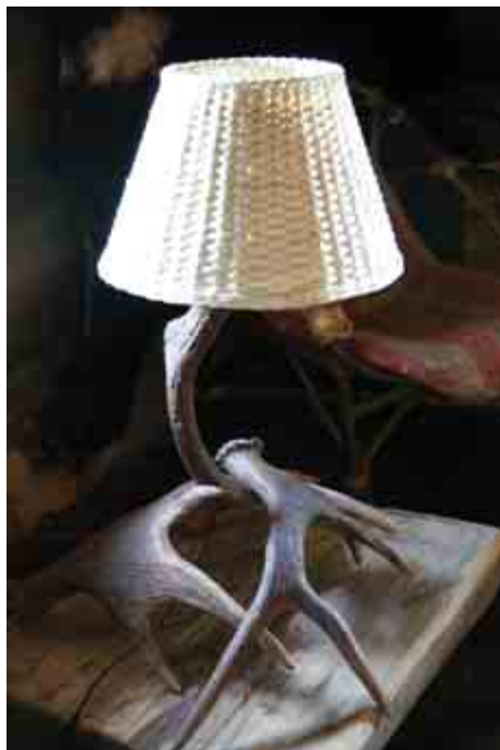
Слева: В свободное время Арсений занимается изготовлением таких ламп