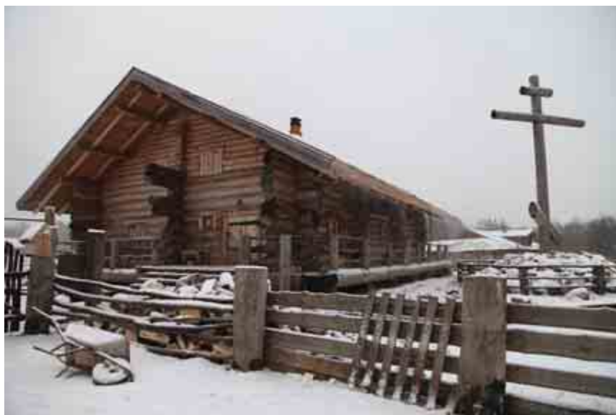
Дом, который построил Арсений. Православный поклонный Крест