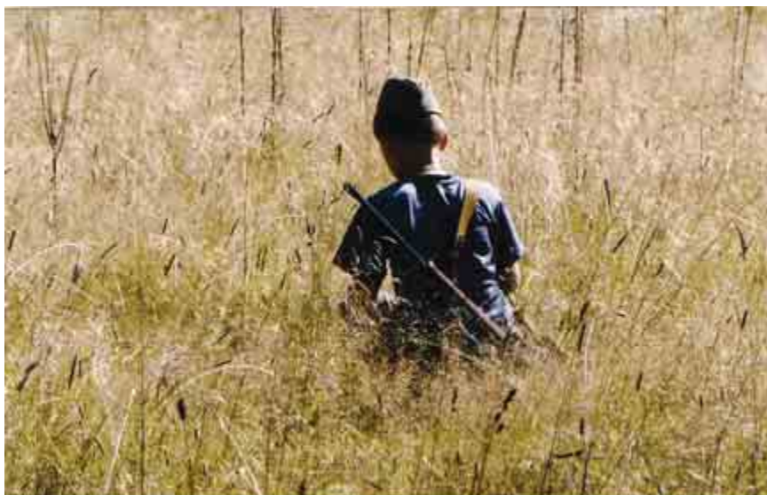
Внизу: Арсений. На охоту