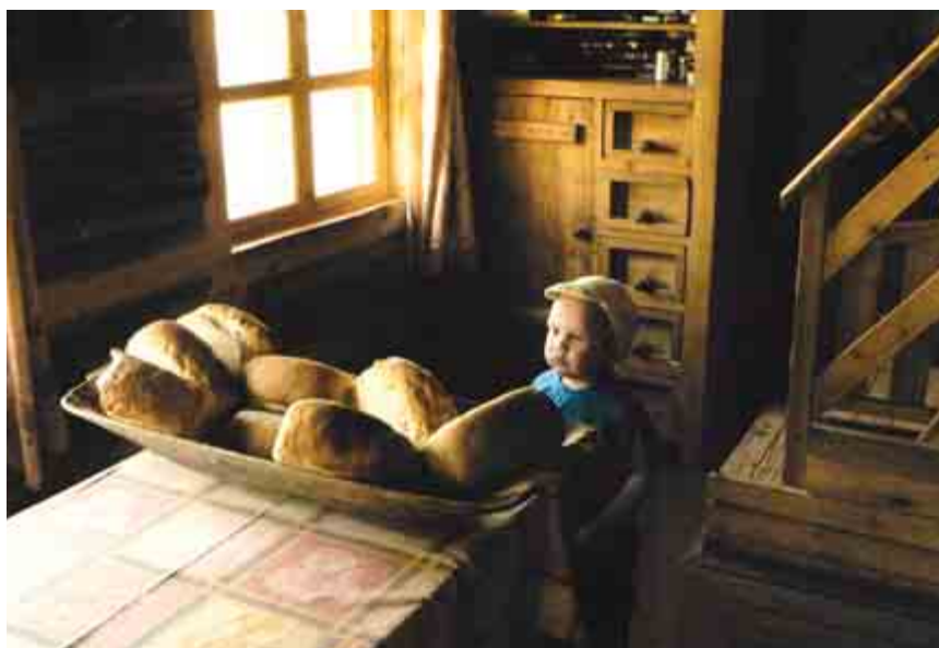
Первая проба готовить свой хлеб в русской печи