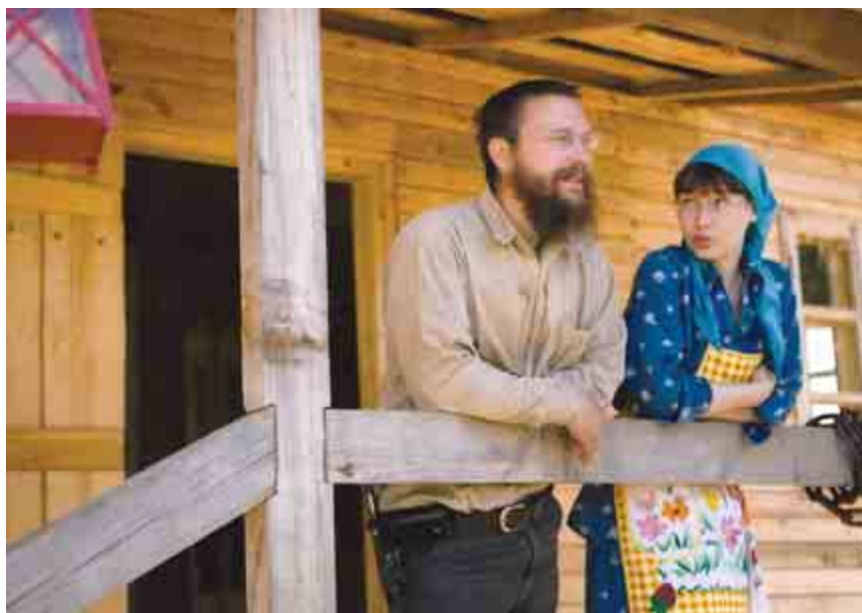
На крыльце дома