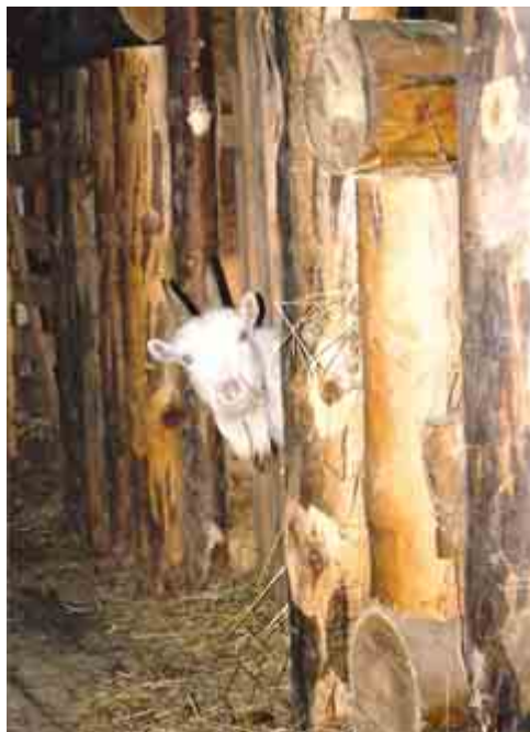
Козы очень любопытны