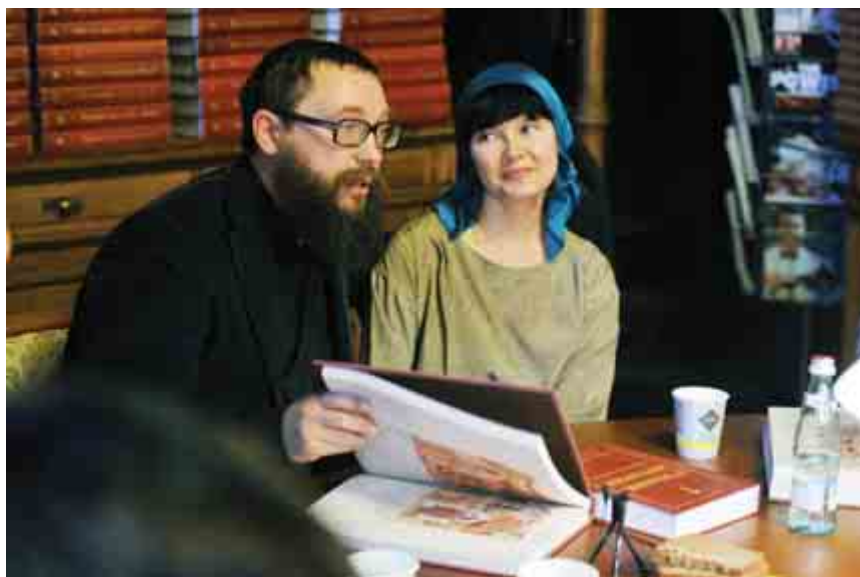
В Питере презентация второго тома учебника истории