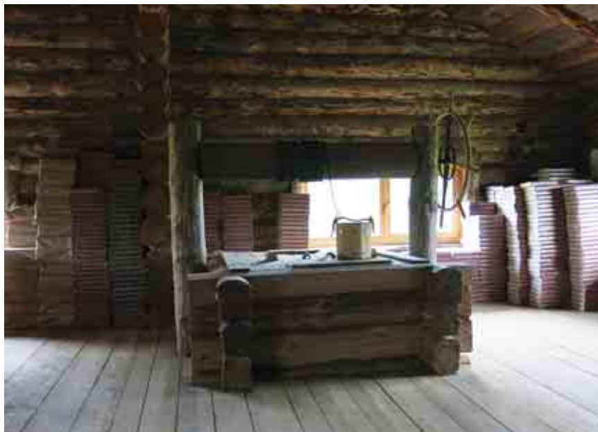
Колодец внутри пекарни