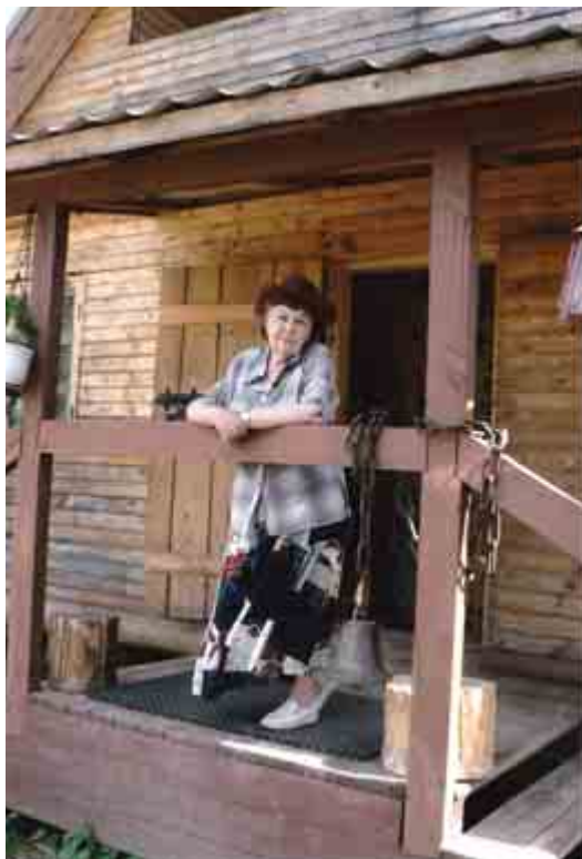
Слева: Мама Германа у нас в гостях. Первая осень после пожара