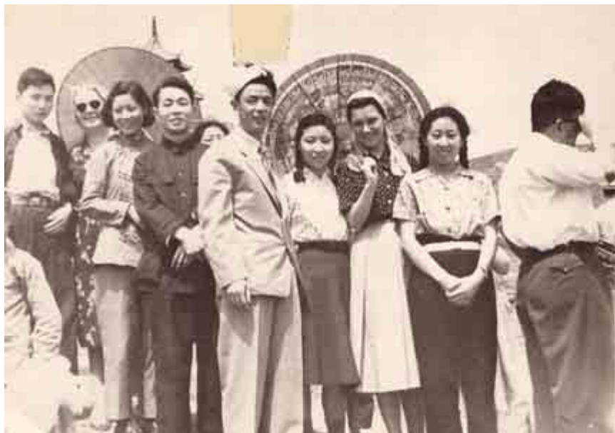
Мама в Шанхае, под зонтиком в платке