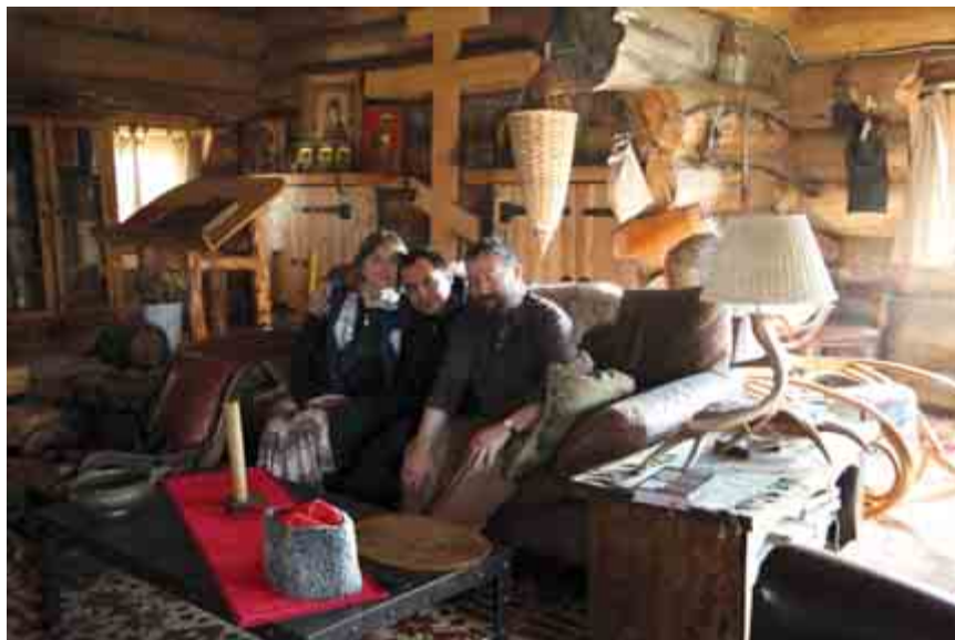
Гости с Украины