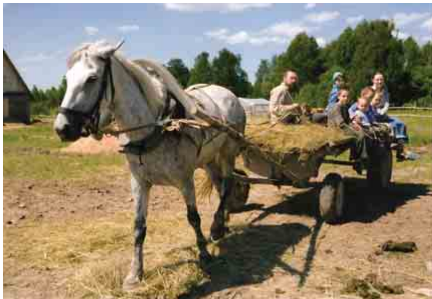
Осваиваем новый вид транспорта