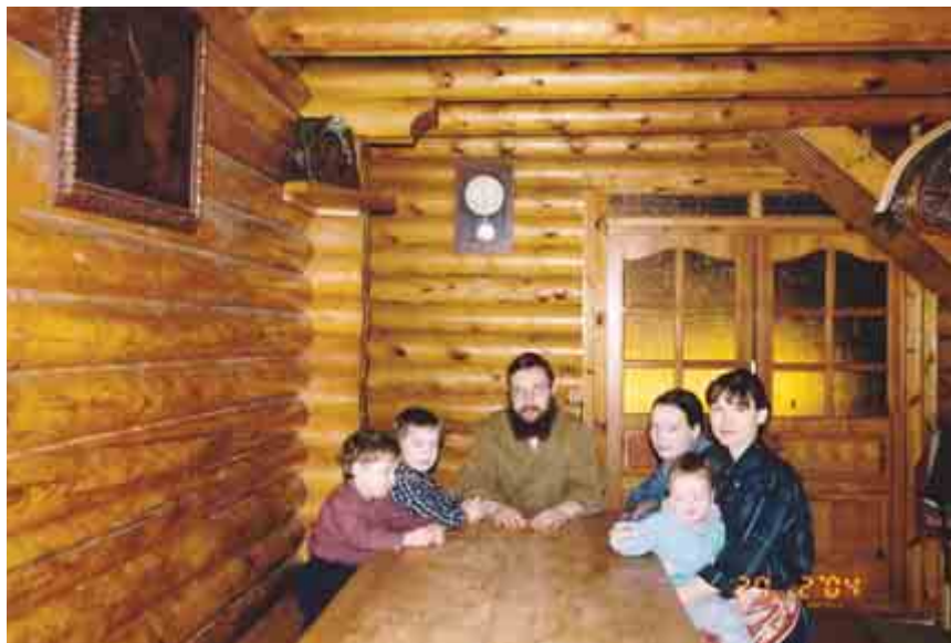
Вверху: Последний день на Рублевке