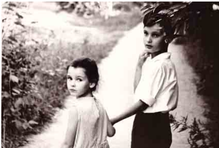
Я с братом на даче