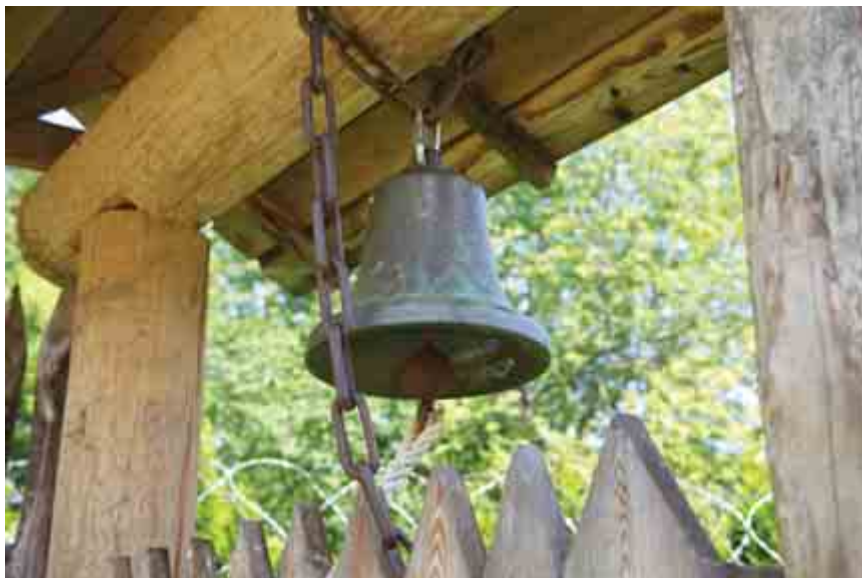
Биржевой колокол с «Алисы» теперь служит вместо звонка на воротах