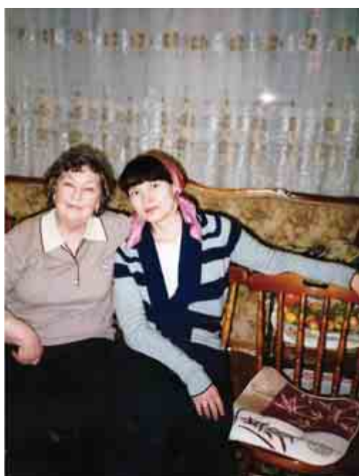
Счастливые уже бабушка с пробабушкой